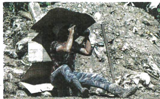
ORANG ramai dinasihatkan untuk mengehendkan tempoh berada di luar bangunan ketika cuaca panas. – GAMBAR HIASAN

Fenomena El Nino sering menyebabkan hujan berkurangan sekali gus berisiko mengakibatkan paras air sungai merosot dan empangan menjadi kering.